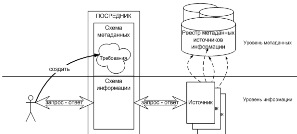
Рисунок 1. Общая схема инфраструктуры посредника

например, реестры UDDI [1515], или реестры, поддерживающие протокол обмена метаданными OAI-PMH [8], не обладают достаточными сервисами для поиска источников с нужными характеристиками. В ряде работ (например [14, 12, 10]) предлагаются методы, расширяющие возможности реестров использованием онтологий в спецификациях источников. В таких работах приводятся алгоритмы поиска в реестрах, расширенных соответствующим образом. Не известны работы, посвященные поиску источников информации в контексте задачи регистрации источников информации в посредниках. В настоящей работе рассматривается метод идентификации источников информации по метаданным для последующей их регистрации в посреднике. Работа ведется в рамках проекта создания предметных посредников [5]. Разработан прототип программного средства, реализующего поиск по метаданным предлагаемым способом релевантных посреднику источников, в соответствии с архитектурой посредника [6].