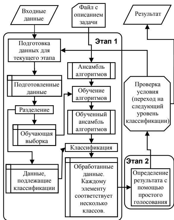
Рис. 3. Схема работы ансамбля классификаторов в задаче о классификации затменных двойных звезд

Этот файл, а также каталог объектов, были помещены в MySpace, и была проведена классификация. Схема работы Ensembled Weka для задачи о классификации двойных затменных звезд приведена на рис. 3.